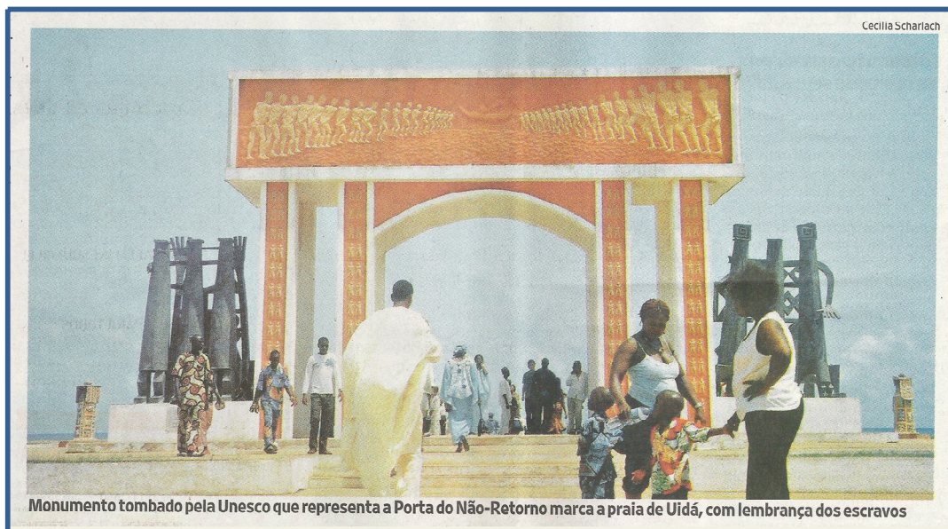
FOTO DO MONUMENTO TOMBADO PELA UNESCO COM LEMBRANÇA DOS ESCRAVOS